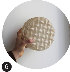
6 Applique murale Réemploi in situ