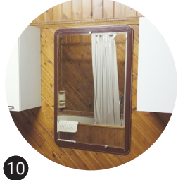
10 Miroir Réemploi in situ