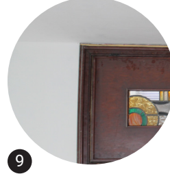
9 Portes Réemploi in situ