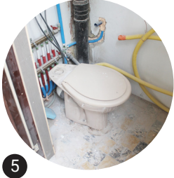
5 WC sur pied Réemploi in situ