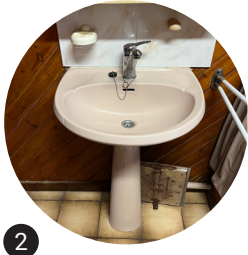
2 Lavabo sur colonne Réemploi in situ