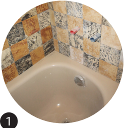
1 Baignoire Réemploi in situ