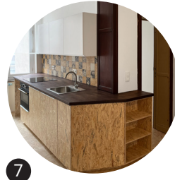
7 Meubles de cuisine en OSB New