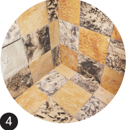
4 Carrelage en céramique Réemploi in situ