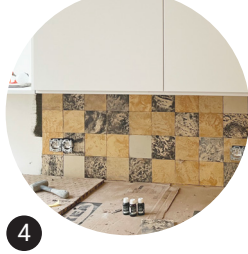
4 Carrelage en céramique Réemploi in situ