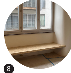
8 Banquette sur mesure en OSB New