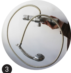
3 Robinetterie Réemploi in situ