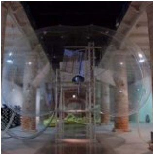
Architekturbiennale Venedig: «Out There: Architecture Beyond Building»

Die 12. Architekturbiennale in Venedig verzichtet auf Programmatik und triumphale Geste